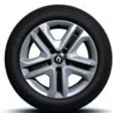
Jante oțel 16" Flexwheel, design Complea