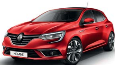
Rouge Flamme (NNP)