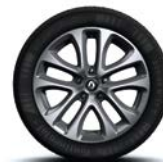
Jante aliaj 17" specific GT, design Decaro