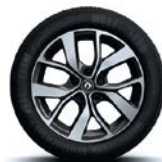
Jante aliaj 17", design Celsius