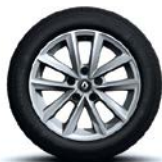
Jante aliaj 16", design Silverline