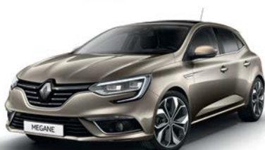
Beige Dune (HNP) Indisponibil GT