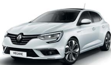
Blanc Glacier (369 - opacă)