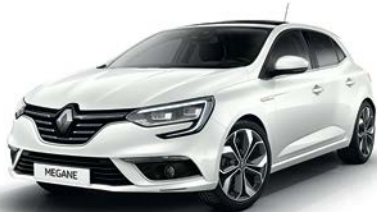
Blanc Nacré (QNC)