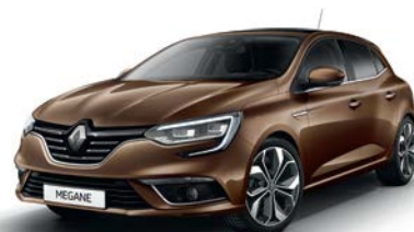
Brun Cappuccino (CNL) Indisponibil GT