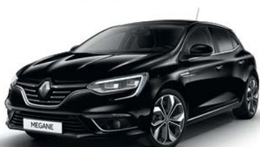
Noir Étoilé (GNE)