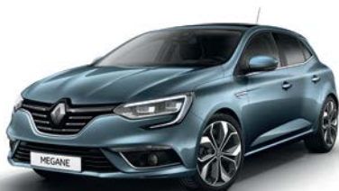
Bleu Berlin (RQE)