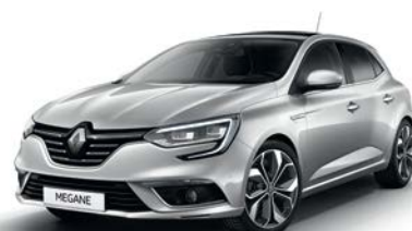
Gris Platine (D69)