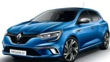
Bleu Iron (RQH) Doar pentru GT