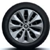
Jante oțel 16", design Florida