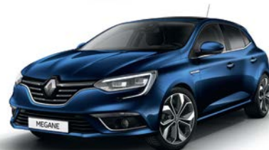
Bleu Cosmos (RPR) Indisponibil GT