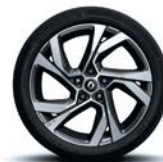
Jante aliaj 18", design Magny Cours