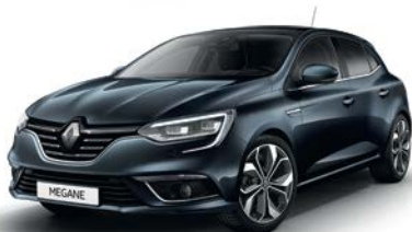
Gris Titanium (KPN)